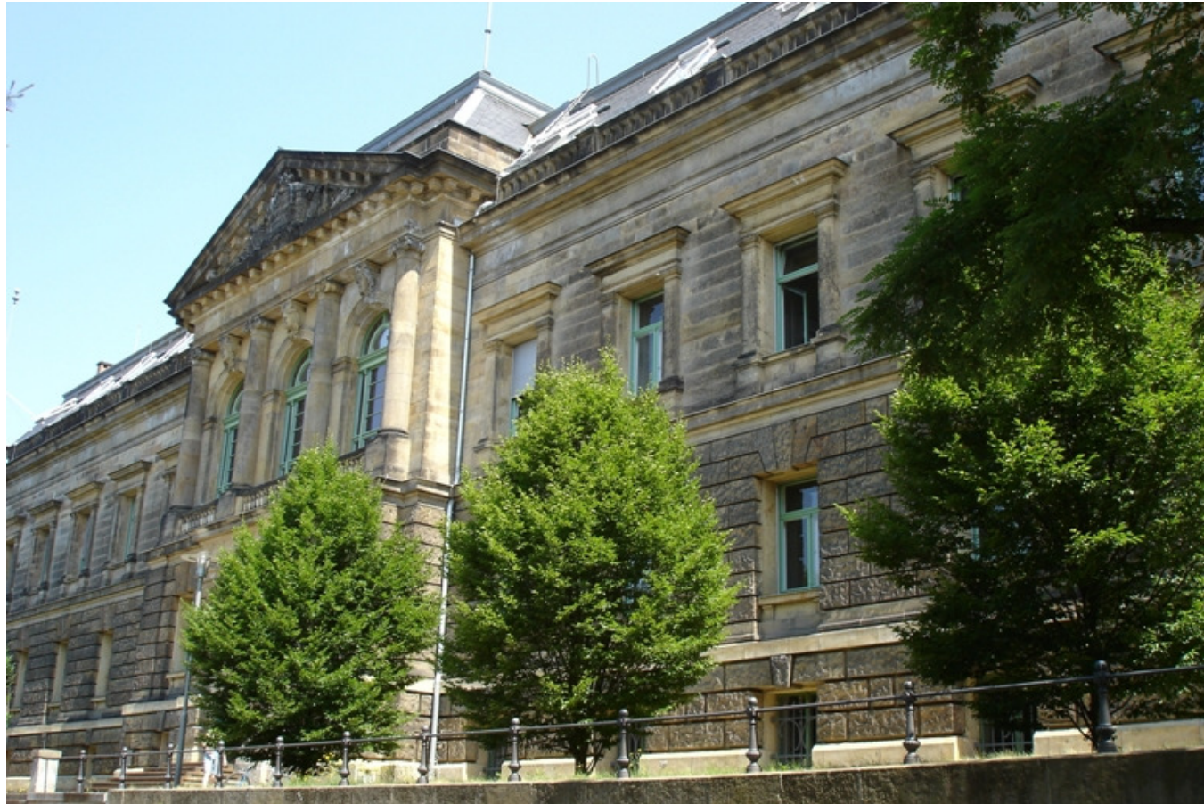
Dienstgebäude BAuA Dresden