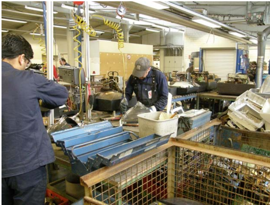
Abb.1: Demontagearbeitsplätze

Bei den Demontearbeiten an den Geräten ist somit eine Gefahrstoffaufnahme über die Atemwege, die Haut und den Mund möglich (dermale, inhalative und orale Aufnahme). Bei den Demontearbeiten kann eine Vielzahl verschiedener Gefahrstoffe freigesetzt werden. Vorkommen und Gefährdungspotenzial ausgewählter Stoffe sind nachfolgend beschrieben.