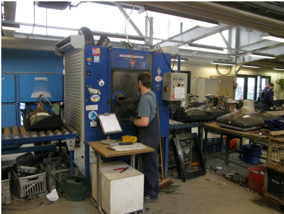
Abb.2: Reinigungsarbeiten in der Reinigungskabine